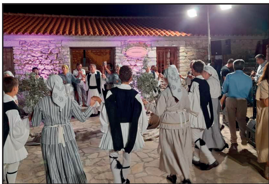
Μουσικό- χορευτικό δρώμενο από τον ΜΕΣΚ