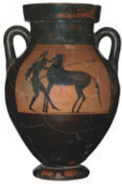
Αμφορέας, Αρχαιολογικό Μουσείο